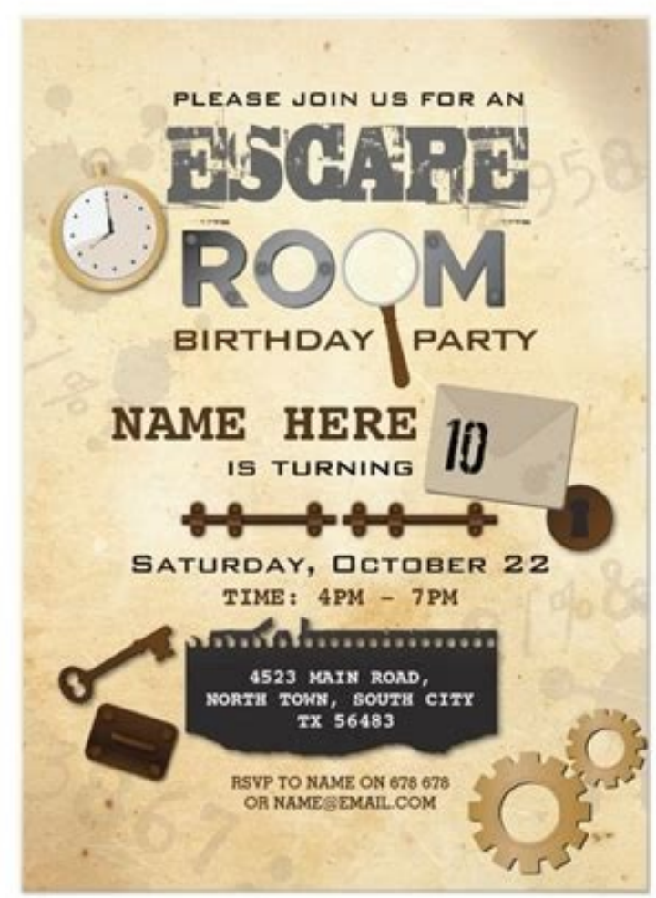
Escape Room Birthday Party Invita... by WOWWOWMEOW Zazzle